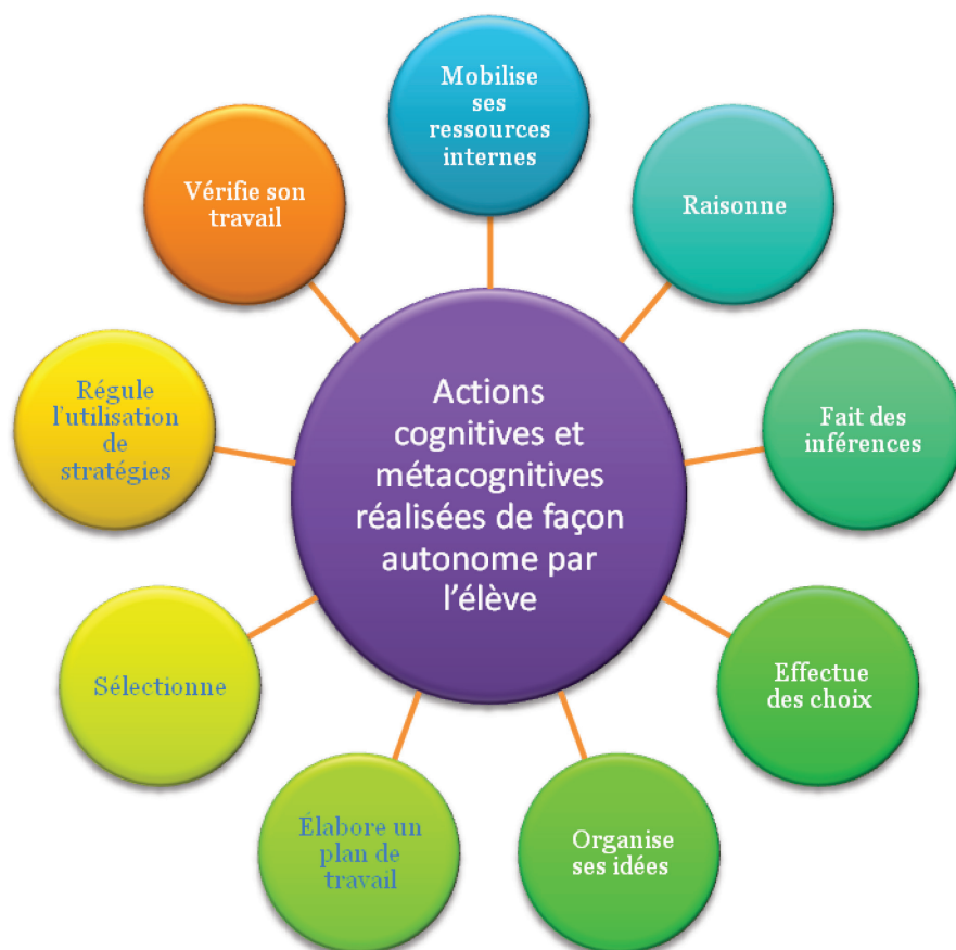
Schéma 1 - Exemples d'actions témoignant de l'engagement cognitif de l'élève